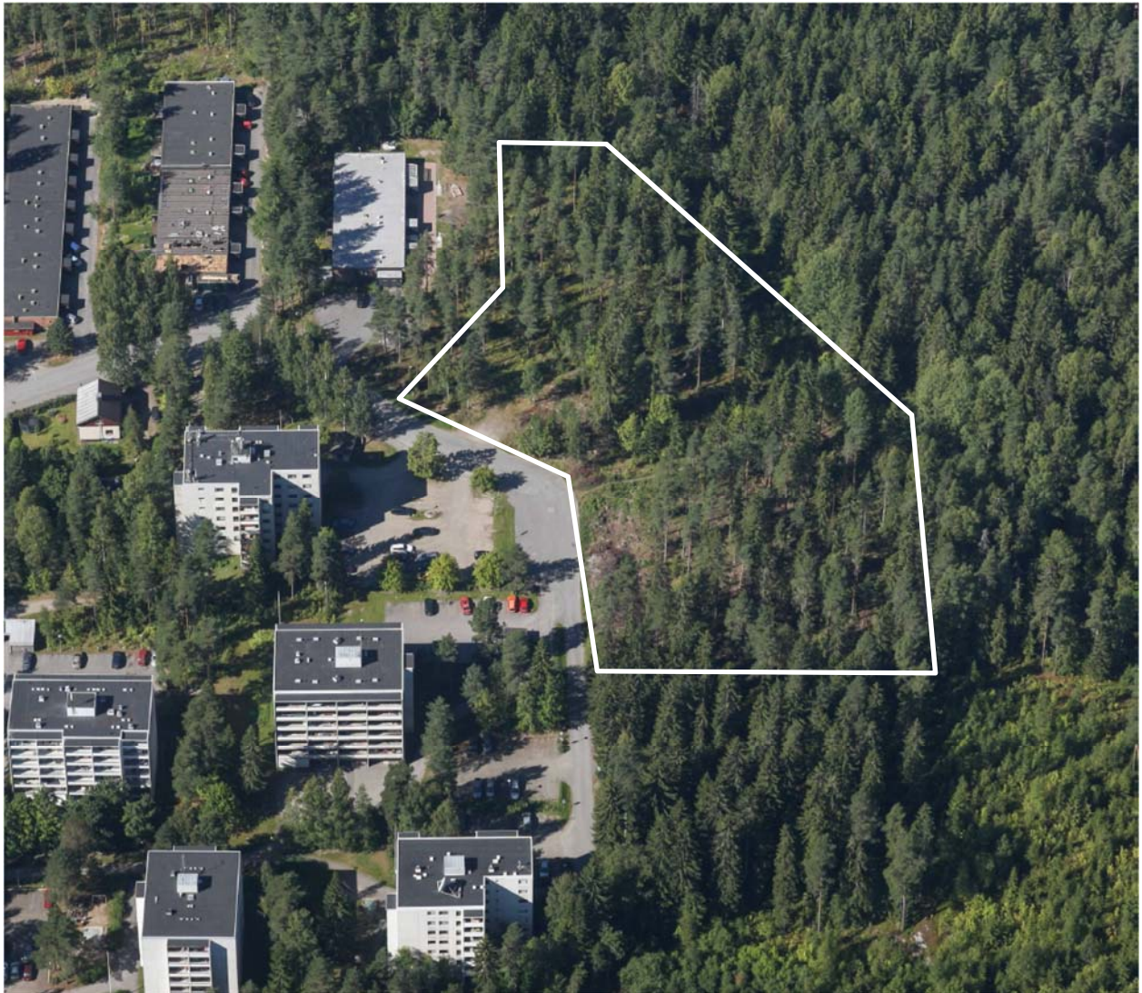
Viistokuva suunnittelualueesta. Suunnittelualue on rajattu kuvaan viitteellisesti.