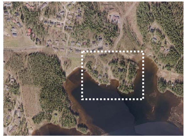
Ilmakuva suunnittelualueesta. Suunnittelualue on rajattu kuvaan viitteellisesti.