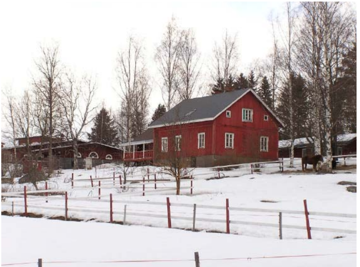
Kuva 1. Uusi-Laulaalan talouskeskus koulun pohjoispuolella

05.04.2004 / 16.04.2004 / 16.06.2004 / 14.10.2004 /03.01.2005 /12.12.2005 20.04.2006 / 07.11.2006