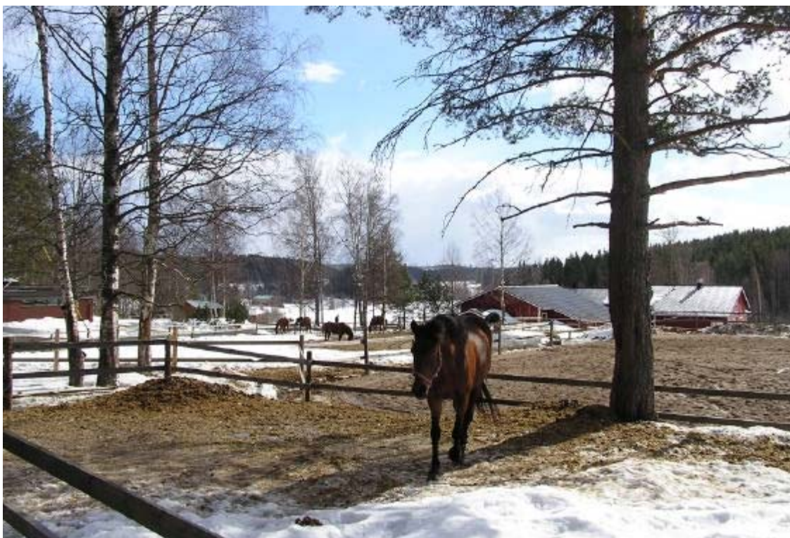
Kuva 4. Hevostila Saarenmaalle johtavan Kennäntien varressa

Puuppolassa on toimivia maatiloja, hevoskasvatustoimintaa, puutarhayrityksiä ja muutamia pienteollisuusyrityksiä. Kaava laaditaan sellaiseksi, että se ottaa parhaalla mahdollisella tavalla huomioon yritystoiminnan jatkamisen edellytykset.