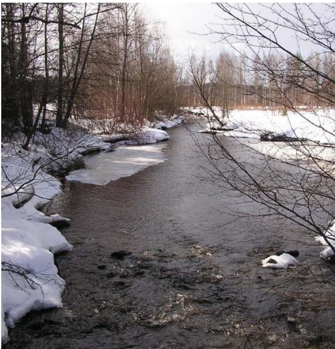
Kuva 3. Makkarajoki ennen kevättulvaa