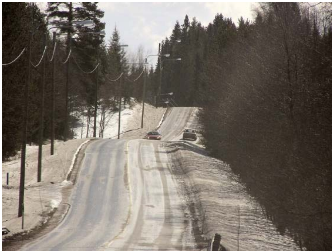
Kuva 2. Kevyen liikenteen väylän puuttuminen Puuppোলantien varrelta Korttajärven eteläpuolisella alueella on merkittävä korjaamista vaativa puute.

Palokkaan. Merkittävin puute alueen kevyen liikenteen väylästössä on tällaisen puuttuminen toistaiseksi Puuppোলantien varresta Korttajärven eteläpuolisella alueella.