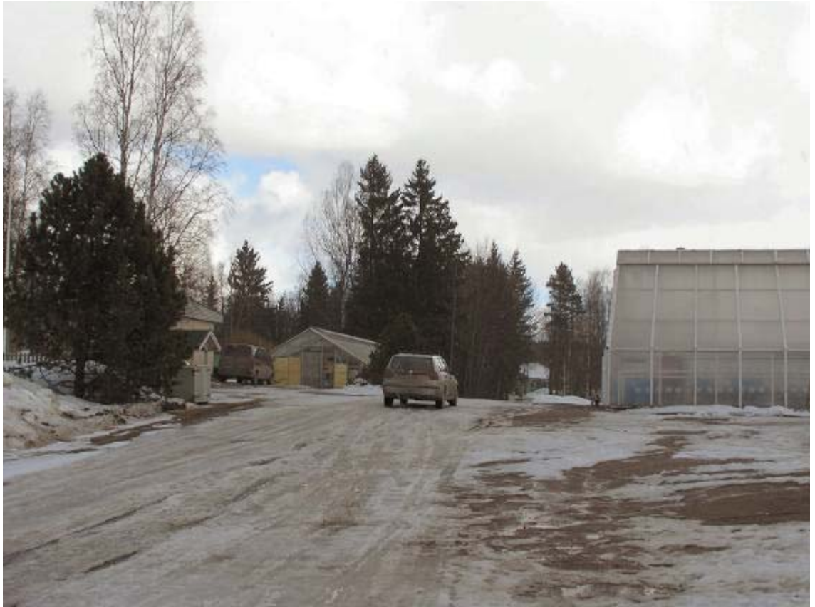
Kuva 5. Liikenne Lehesjärventien alkupäässä haittaa nykyisellään puutarhayrityksen toimintaa