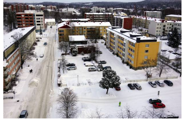
Viistokuva suunnittelualueesta lounaan suunnasta.