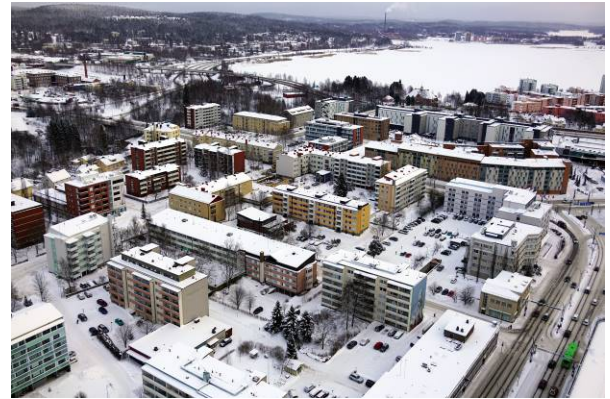
Viistokuva suunnittelualueesta ja lähiympäristöstä lännen suunnasta.