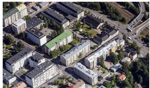
Viistokuva suunnittelualueesta lännen suunnasta.