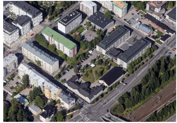
Viistokuva suunnittelualueesta etelän suunnasta.

Puh. (014) 266 5034 email mauri.hahkioniemi@jkl.fi internet www.jyvaskyla.fi/kaavoitus